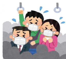
混雑した乗り物の中