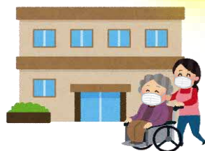
高齢者施設など に行くとき